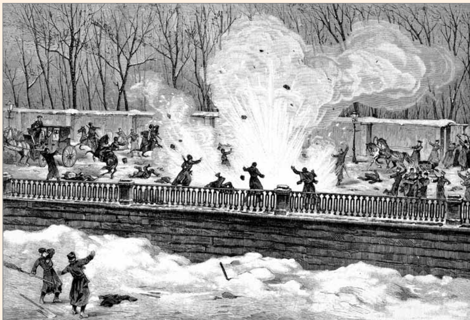
Покушение на жизнь императора Александра II. Взрыв второго снаряда. 1 марта 1881 года.

Взгляды современников и историков на личность и реформы царя-освободителя, как известно, разнятся. Быть может, самую крайнюю точку зрения представляет Вера Ивановна Засулич в публикуемом ниже тексте хранящегося в РГАСПИ документа: «Срамной старик, дрожащий от страха и злости». Есть там и другие, аналогичные или даже более оскорбительные метафоры,