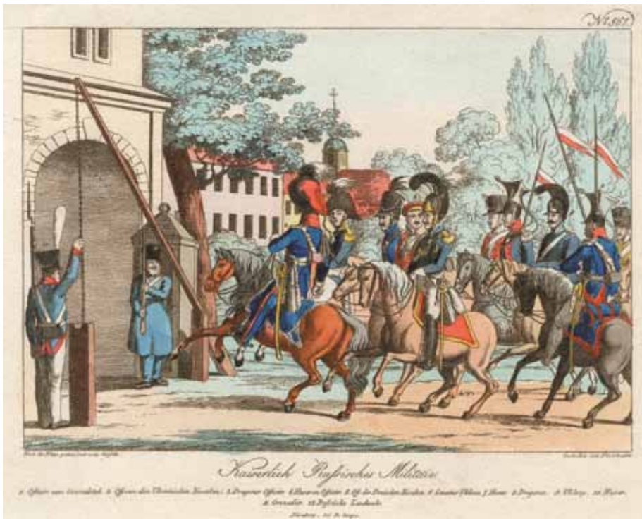
Keiserlich russisches Militair (Русская имперская армия).

Нос, привезенный Наполеоном с собою из России в Париж. Художник Иван Тербенев.