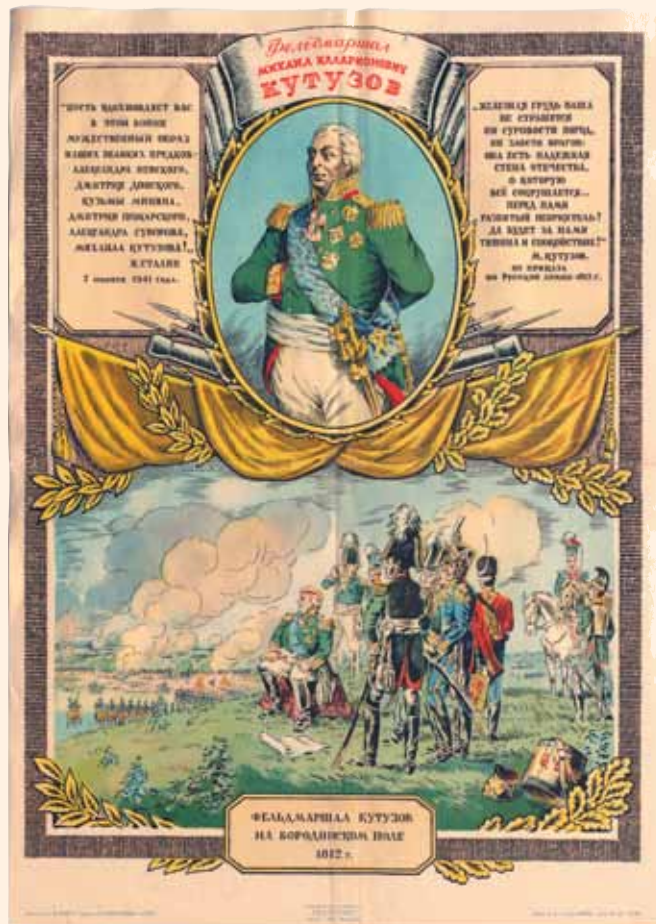
Фото № 3.

РГАСПИ. Ф. 558. Оп. 11. Д. 1516. Л. 114. Подлинник. (Приложение: фото № 3)