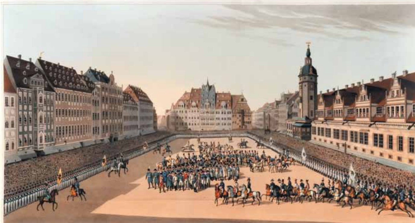
Grand Entry of the Allied Sovereigns into Leipzig, 19 October 1813.