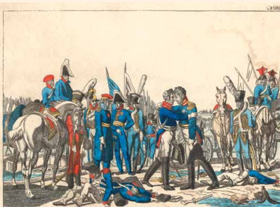
Ende der Feindseligkeiten nach dem zwanzigjährigen schrecklichen Völkerkriege. 29 марта 1814 г. (Конец торжества врага после двадцатилетней ужасной гражданской войны).

Р оссийский государственный архив социально-политической истории известен прежде всего своими коллекциями документов по истории РСДРП—РКП(б)—ВКП(б)—КПСС и Советского государства. Малоизвестен тот факт, что РГАСПИ хранит обширные коллекции документов и артефактов по социальной истории Европы XVIII — начала XX веков, является уникальным учреждением культуры, хранящим в том числе более 200 тысяч единиц музейных раритетов. Среди этих коллекций в фонде 654 находится и обширное (более 10 000 листов) собрание французской гравюры периода Великой Французской революции и Первой империи (1789–1815). С момента появления тиражной графики её роль в культурной и, подчеркнём, — политической жизни Европы была неизменно значительной. Особенно отчётливо эта черта проявлялась в периоды обострения политической борьбы, когда гравюра становилась мощнейшим инструментом агитации и пропаганды, оказывая мощное влияние на формирование общественного мнения, но одновременно оставаясь и самым